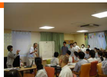
KYTトレーニング研修の様子