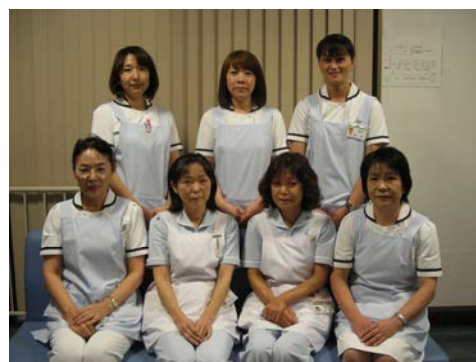
笑顔あふれる対応を心掛けています

これからも患者さんが安全で快適に診察を受けることができるようにしっかりと外来看護体制を築いてまいります。ご意見やご希望があれば遠慮なさらずどうぞお声掛けください。