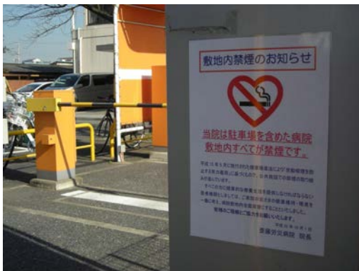
駐車場を含め敷地内が全面禁煙です。

学校、体育館、病院、劇場、観覧場、集会場、展示場、百貨店、事務所、官公庁施設、飲食店その他の多数の者が利用する施設を管理する者は、これらを利用する者について、受動喫煙（室内又はこれに準ずる環境において、他人のたばこの煙を吸わされることをいう。）を防止するために必要な措置を講ずるように努めなければならない。