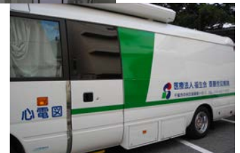
機能的に優れた健診車を2台導入